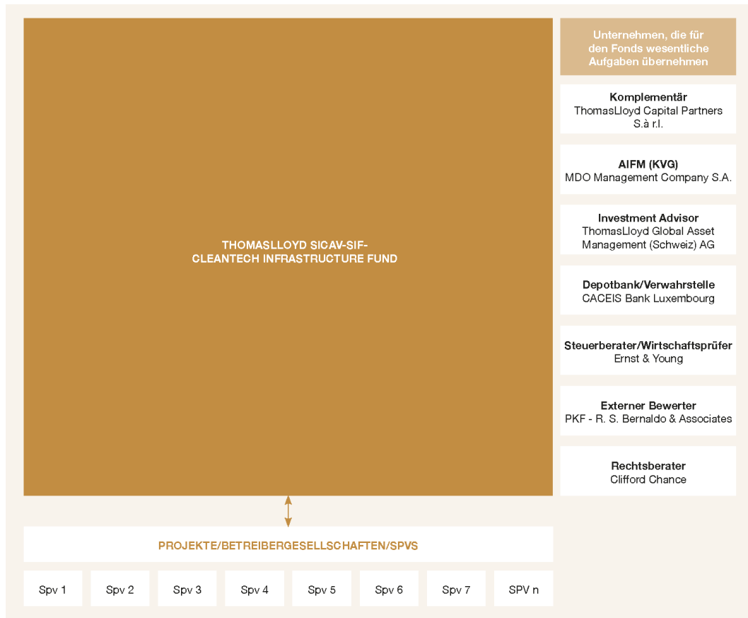
Abbildung 2: Investmentstruktur Luxemburg